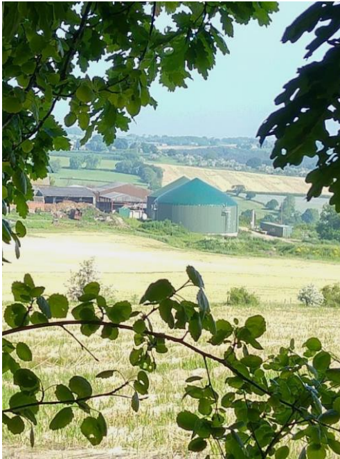
Die Biogasanlage von Clayton Hall Farms